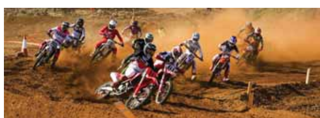
Ljósmynd: Stefania Reynisdóttir.