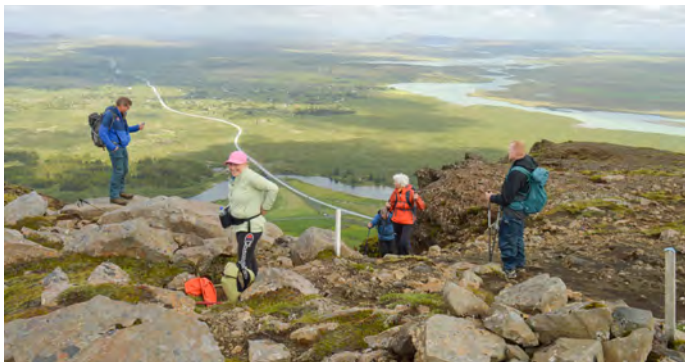
Gönguhópur sem er að koma upp á fjallsbrún við gönguskarðið fyrir ofan Alviðru.

Gengið verður frá bænum Alviðru eftir merktri gönguleið um gönguskarð ofan við bæinn og upp að Inghól, þar sem Ingólfrur landsnámsmaður var heygður. Þaðan er afar víðsýnt á góðum