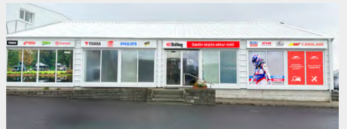
Nýja útibúð við Hrísmýri 2a á Selfossi.