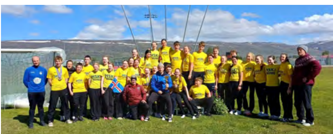
Sigurlið HSK Selfoss ásamt þjálfurum.

Nánari úrslit einstakra keppenda má finna á UMFS.is.