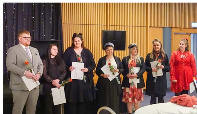
Nemendur í Leikskólaliða- og stuðningsfulltrúabru.