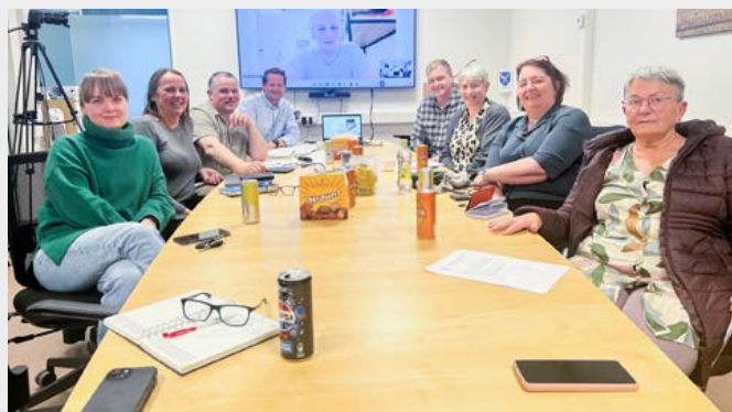
Frá fyrsta fundi nefndarinnar í síðustu viku. Mynd: Aðsend.

var haldinn á Hellu 9. júní sl. Nefndarmenn mættu allir á fundinn og var einn þeirra staddur í Grikklandi, en tók þátt í fundinum með fjarfundararbúnaði.