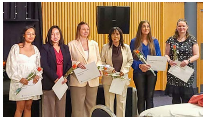
Nemendur í Félagsliðagátt.