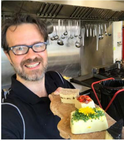
Elli í eldhúsinu.

Nýsköpunarfyrirtækið Livefood ehf. í Hveragerði, eina grænkerasta-gerðin á Íslandi, hlaut nýverið veglegan 27.790.000 kr. styrk úr Matvælasjóði til þróunar á nýjum „brauðásti“ – plöntubaseruðum valkosti við hefðbundinn brauðost.