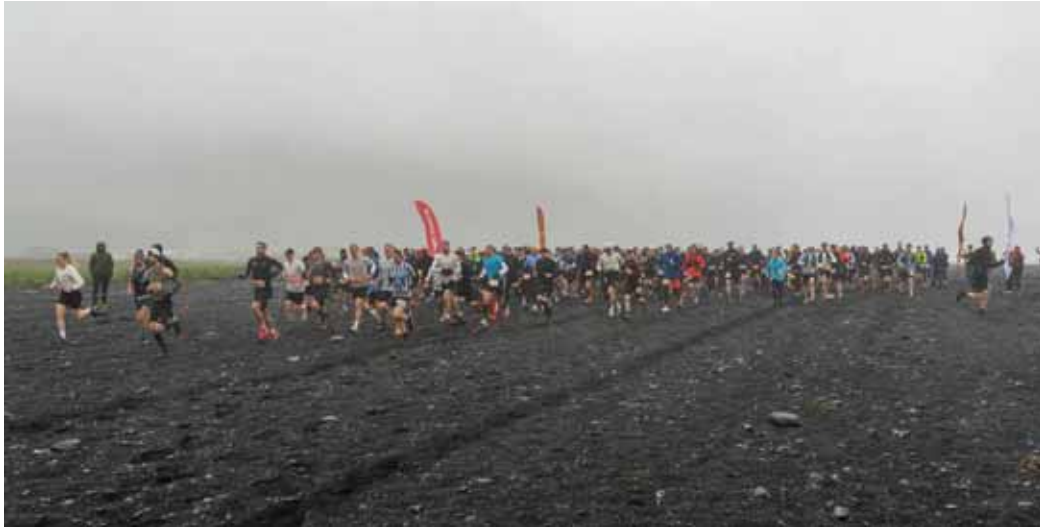
Keppendur hlaupa af stað í fjörinni í Vík.