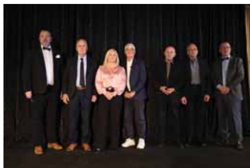
Gullmerki Umf. Selfoss