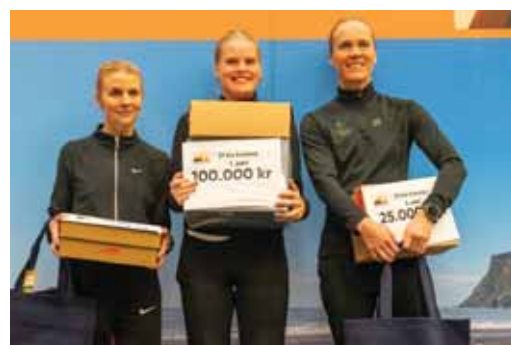
Verðlaunapallur 21 km kvenna.