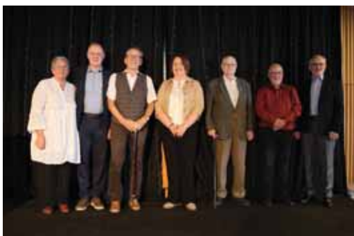
Fjögur gullmerki og eitt silfurmerki HSK (Ófeigur silfur)