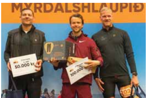
Verðlaunapallur 21 km karla.

Þrátt fyrir erfiðar aðstæður voru keppendur sammála um að skipulag, merkingar og brautarvarsla hefðu verið til fyrirmyndar. Mýrdalshlaupið hefur verið haldið í núverandi mynd frá 2020 og hefur fest sig í sessi sem eitt krefjandi utanvegahlaup landsins. Í ár voru þátttakendur frá 15 löndum skráðir til leiks.