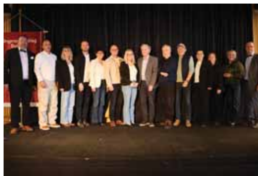
Silfurmerki Umf. Selfoss, tveir bættust við