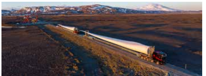
Mynd frá fyrstu vindmylluflutningum.

Flutningarnir fara að mestu fram að næturlagi sex daga vikunnar til að draga úr áhrifum á almenna umferð. Lögregla og Vegagerðin stýra framkvæmdunum og víða hefur þurft að breikka vegi, styrkja gatnamót og undirbúa flutningsleiðina sérstaklega fyrir verkefnið.