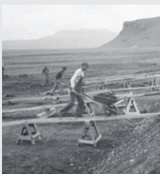
Varnargarðar vegna Markarfljótsins við Dímon.