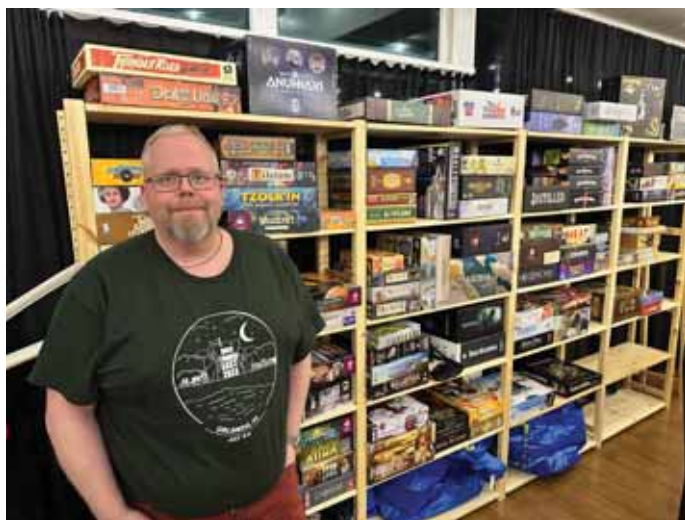
Mynd af Hilamari tekin á Spilavin árið 2024. Í bakrunn má sjá hluta af borðspilasafninu.

Hilmar mætir persónulega með hátt í 400 borðspil af 1000 borðspilum sem hann á sjálfur sem gestir á staðnum geta gengið í. Spilunum stillir Hilmar upp í hillu og fólk hefur aðgang að borðspilasafninu og getur þar af leiðandi valið sér það spil sem það vill. „Það eru allir velkomnir að koma, það er ekki uppselt enn þá þannig að allir geta komið.“