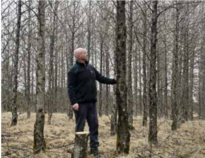
Græðlingaáspirnar 40 árum síðar (2026).

Annað af fyrstu verkefnum var að stinga niður græðlingum í ræktunarbæð. Settir voru niður 1000 græðlingar af alaskavíði og 2000 græðlingar af alaskasp. Trén uxu vel og tveimur árum seinna var þeim plantað út í landið umhverfis bæðið. Þar eru nú 40 árum síðar skógar-