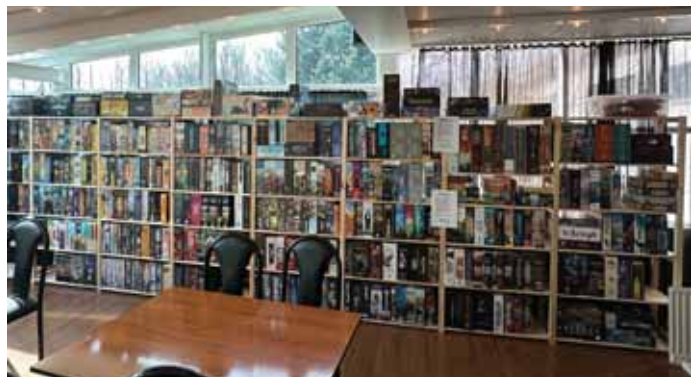
Spilasafnið frá hátíðinni í fyrra en en þá jókst spilasafnið úr 100 spilum í 350.