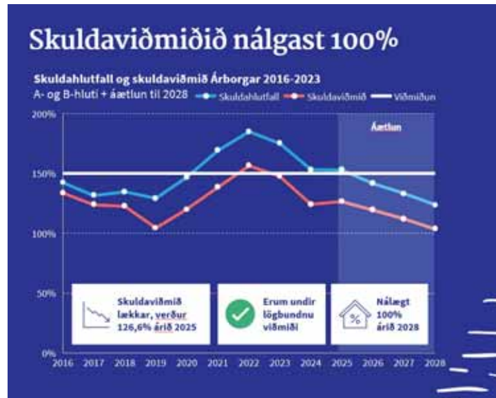
Mynd 2: Skuldaviðmið (rauð lína) og -hlutfall (blá lína).