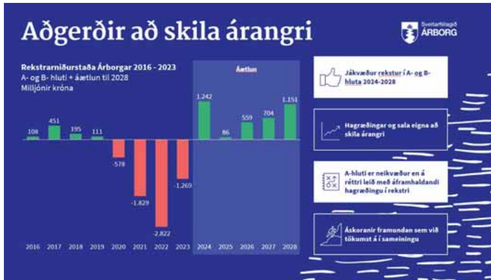
Mynd 1: Rekstrarniðurstæða Árborgar 2016-2023, A- og B- hluti ásamt áætlun til 2028.

Ég vona innilega að lærdómur okkar á undanförunum árum og vel heppnaðar breytingar á verkferlum verði til þess að Sveitarfélagið Árborg þurfi ekki auka skattlagningu á íbúa til að standa undir þjónustu sem því ber að veita - óháð því hvaða einstaklingar standa í brúnni.