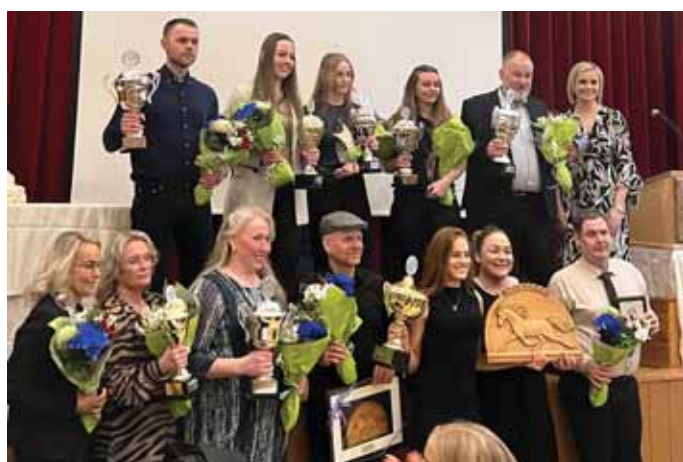
Vinningshafar ásamt formanni.