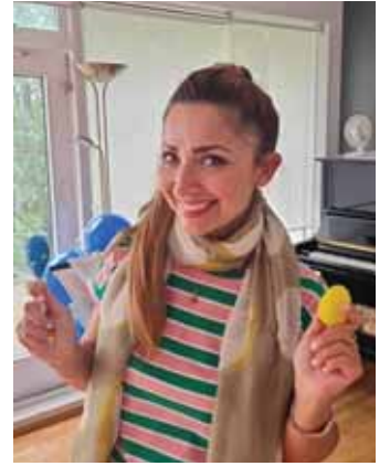
undratónlistar barn í Vík?