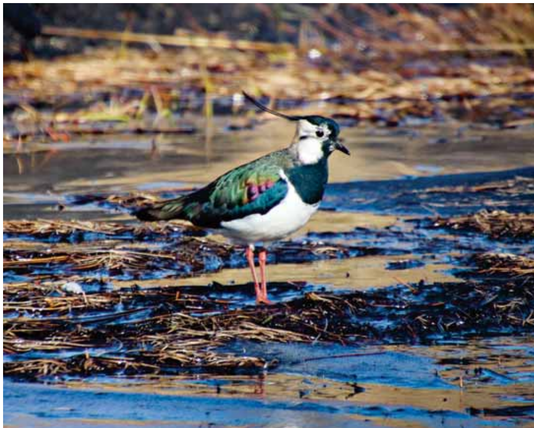
Síðastliðinn laugardag náði Sigurður Eyjólfur þessari einstaklega flottu mynd af Vepju. Myndin er tekin við Pétursey í Mýrdal. Vepja, sem er af lóuætt, er frekar algengur flækjngur á Íslandi og sést hann þá helst á veturna.