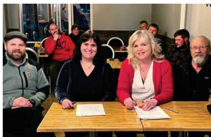
Frá undirskriftinni.

Á fundinum færði Hrunamannahreppur félaginu kamínu í 20 ára afmælisgjöf en vonir standa til að kamínan muni nýtast félagsmönnum sem og öðrum gestum í einum af skálunum á afreitinum.